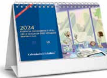
Calendario da tavolo