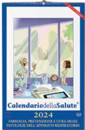
Calendario olandese gigante