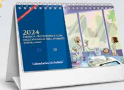
Calendario da tavolo